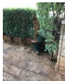
גינה פרטית בבניין מגורים

מנהל מרחב מערב מסר כי מיקום העגלות אינו מפריע לשכנים הגרים בבניין המגורים.