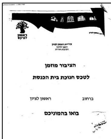
הזמנה מספר 40981 מ-30.3.14