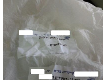
על השקיות רשום כי הפירות והירקות אינם שטופים